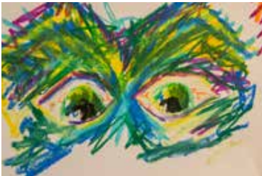
Arbeitschritt 3 Malen des Goggolori mit Ölpastelkreiden