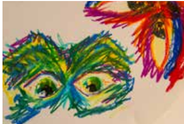
Arbeitschritt 4 Malen des Goggolori mit Ölpastelkreiden