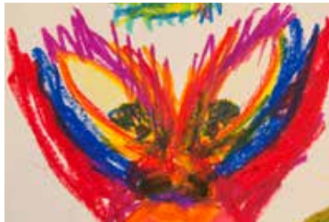
Arbeitschritt 5 Malen des Goggolori mit Ölpastelkreiden