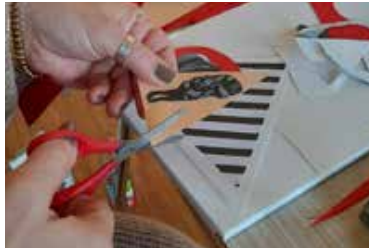
Arbeitsschritt 4 Detailarbeit