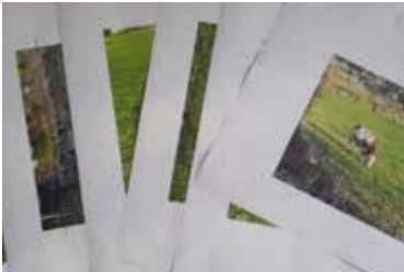
Arbeitsschritt 1 Geeignete Bilder auswählen