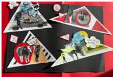
Arbeitsschritt 5 Präsentation des Endprodukts