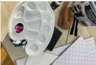
Arbeitsschritt 2 Material sichten