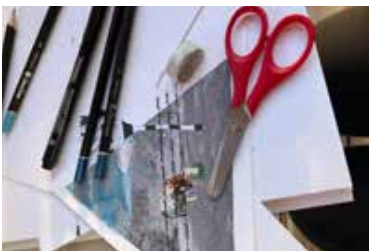
Arbeitsschritt 3 Panels bearbeiten